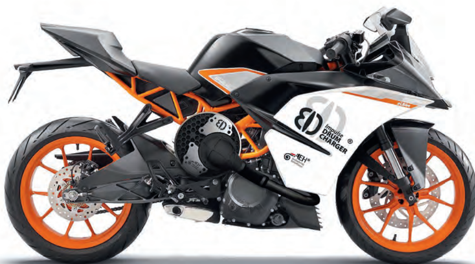
La KTM RC 390 sovralimentata con il sistema Drum Charger esposta al Salone di Milano.

Anche per il 2T il Drum Charger apre strade interessanti, dato che una pompa anche di dimensione non particolarmente grande potrebbe aiutare il lavaggio, riducendo di molto gli HC (idrocarburi incombusti), e raffreddare il cielo del pistone che è sempre un punto critico quando si cercano elevate potenze. Senza contare che una pompa supplementare capace di affiancare il carter pompa potrebbe giustificare un ripensamento ancora più profondo del 2T come lo conosciamo oggi, isolan-